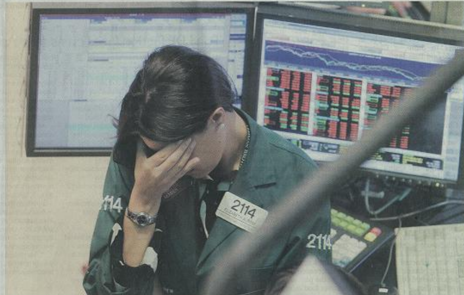
Financial shock: A Lehman Brothers employee rubs her eyes Monday on the floor of the New York Stock Exchange after the company's demise dragged shares down more than 500 points on Wall Street.